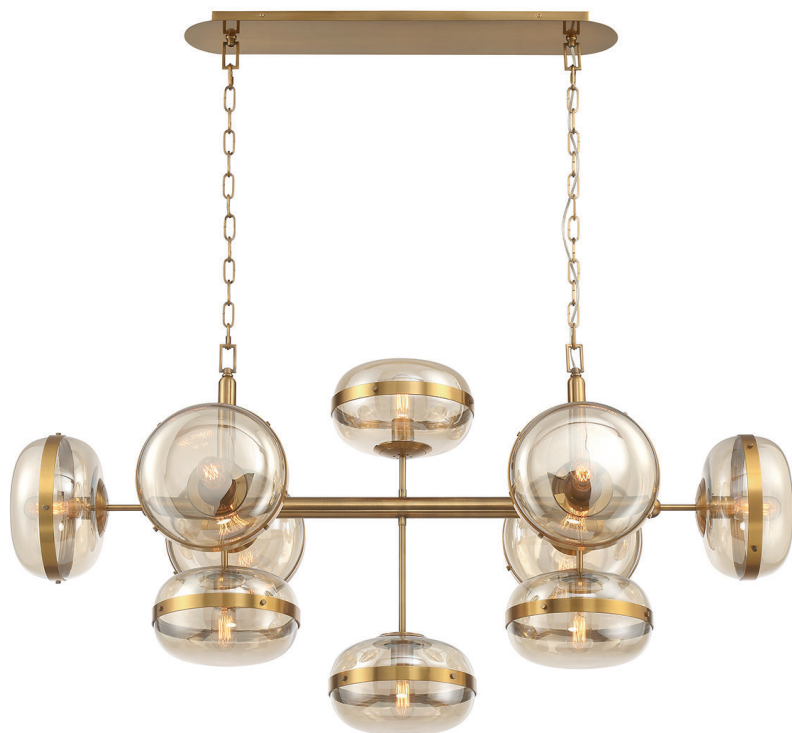
Lampa wisząca Nottingham - 10 źródeł światła - Antyczny miedź