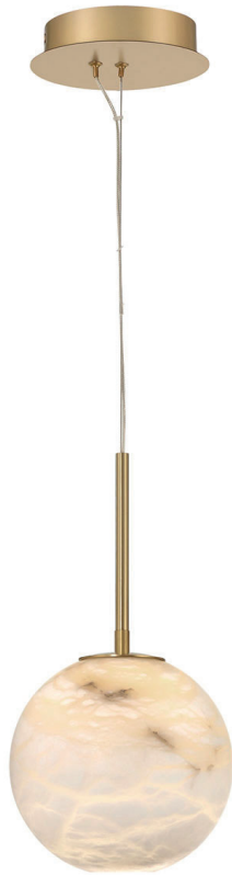
Mała lampa wisząca Kepler - 1 źródło światła - Szrotkowane złoto