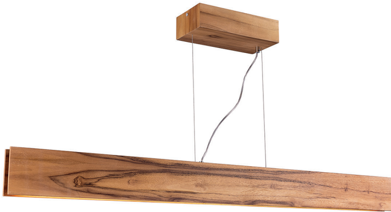
Lampa wyspowa LED Clean