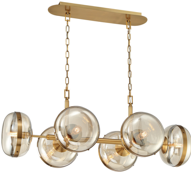
Lampa wisząca Nottingham - 6 źródeł światła - Antyczny mosiądz