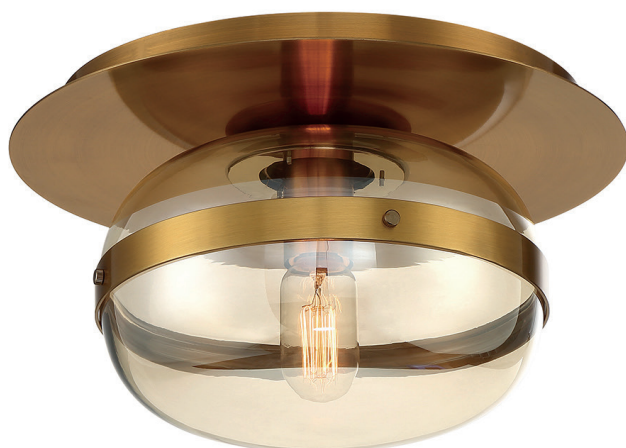
Mały plafon Nottingham - 1 źródło światła - Antyczny mosiądz