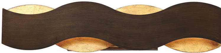
Kinkiet Vaughan - Brązowo-złoty