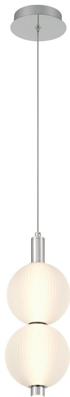
Mała lampa wisząca Palmas - 2 źródła światła - Polerowany nikiel