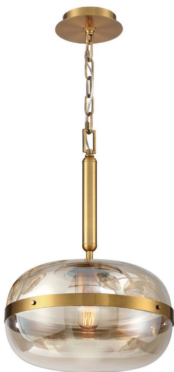
Lampa wisząca Nottingham - 1 źródło światła - Antyczny mosiądz