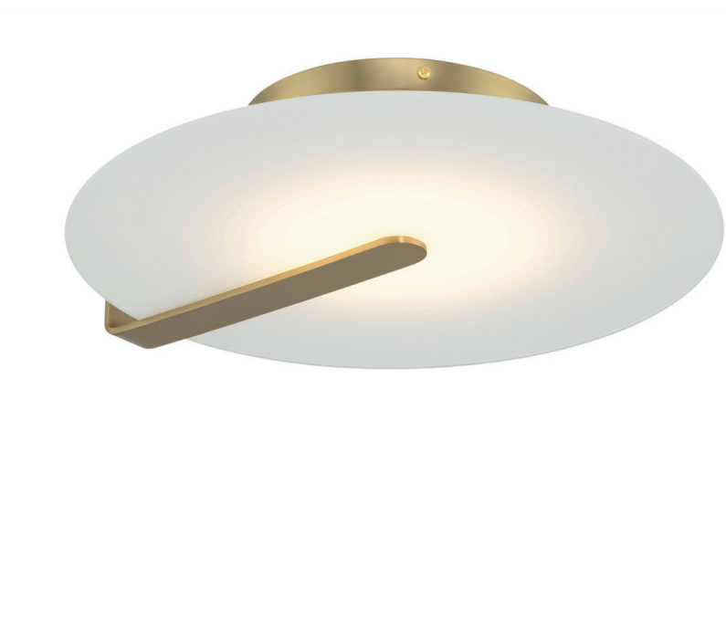
Średni plafon / kinkiet Nuvola - Szcotkowane złoto