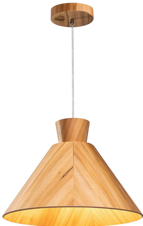
Lampa wisząca Conical