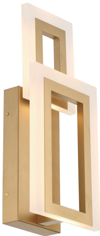
Kinkiet Inizio - Szcotkowane złoto