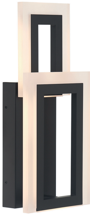
Kinkiet Inizio - Matowa czern