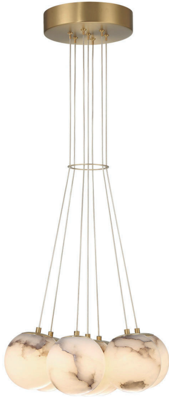
Duża lampa wisząca Kepler - 7 źródeł światła - Szcotkowane złoto