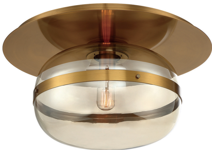
Średni plafon Nottingham - 1 źródło światła - Antyczny mosiądz